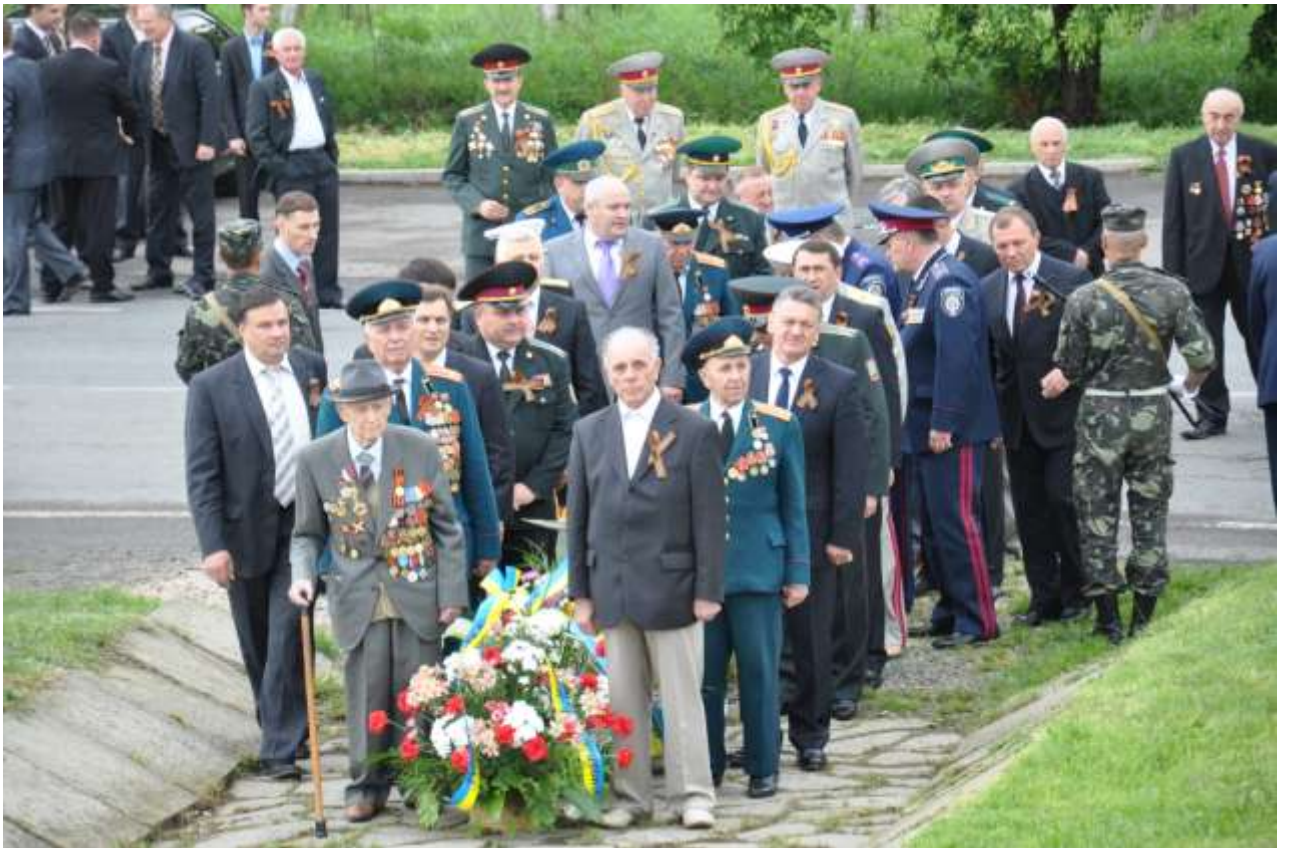
Покладання квітів до монументу Україна – визволителям на українсько – словацькому кордоні 9 травня 2012 року