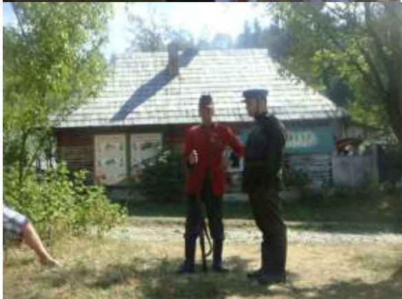
1-5 Снимки на память. В ожидании костюмированного спектакля «разведгруппа «Закарпатцы»».