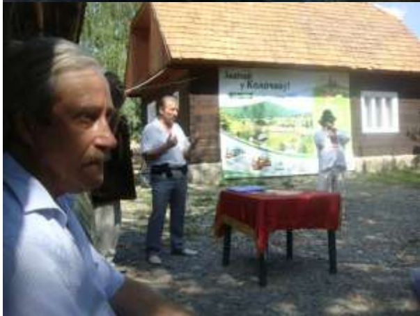
Из зрительного зала – «зелёного Круглого стола»