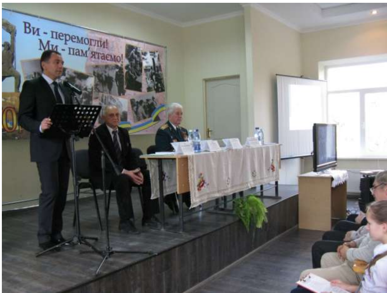
Виступає перший заступник голови облдержадміністрації І.І.Качур.