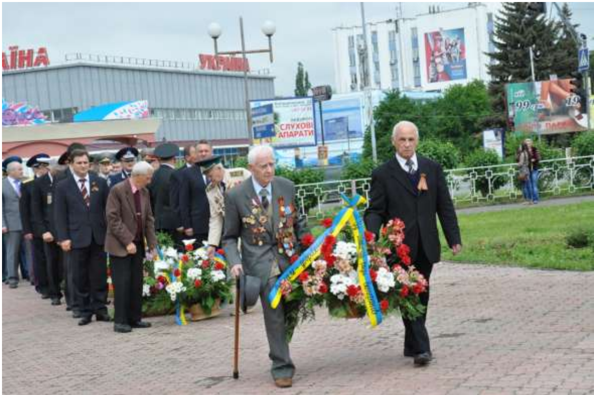
Квіти до пам'ятника добровольцям Закарпаття