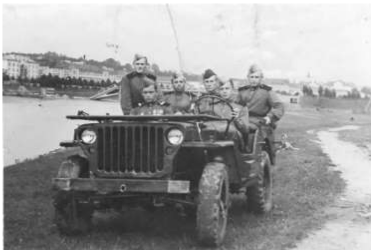
м. Ужгород, 28 жовтня 1944 р.

Нагороджений Орденами Вітчизняної війни II ст., Богдана Хмельницького III ст. медалями : «За відвагу», «За бойові заслуги» так і державними та урядовими нагородами СРСР та України.