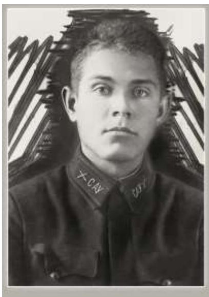
1937год, курсант САУ