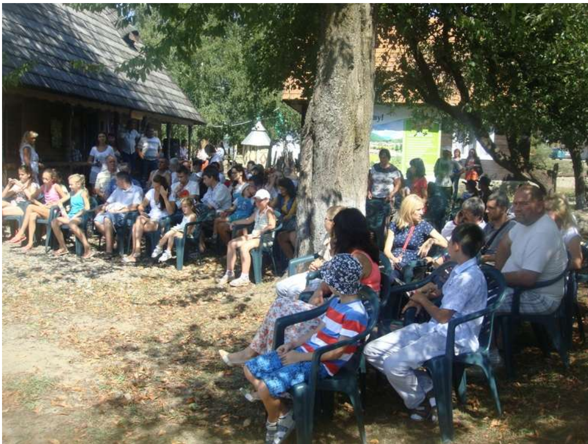
Перед театрализованным представлением – зрители села и гости праздника