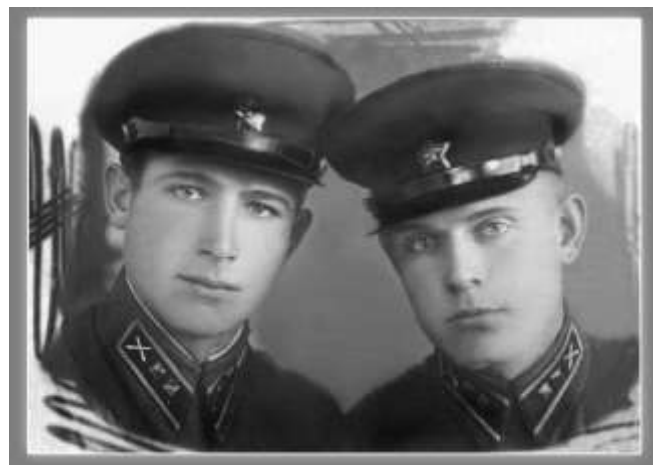
1939год, выпускник САУ

За месяц до начала Великой Отечественной женился, сына, который родился, так и не видел – он умер в годы войны.