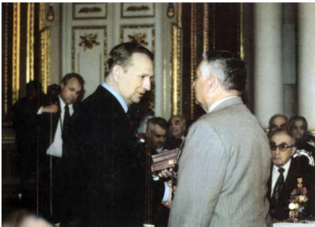
Президент України Кучма Л.М. 8 травня 2002 року вручає орден «За мужність» учаснику Великої Вітчизняної війни Воюцькому К.Т.