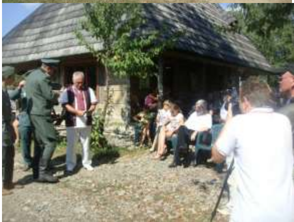
Сцена спектакля «немецкий генерал – в селе» разговаривает с местными полицейскими и жителями села»