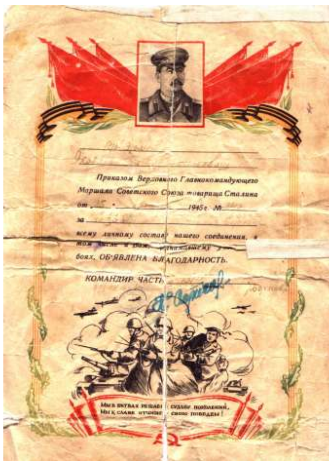
Благодарность «От Сталина» - грамота-поздравление от имени Сталина за Берлин