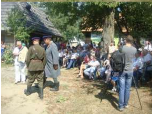
Сцена спектакля «инспекция подготовленности разведчиков комиссаром 3 ранга МГБ СССР Судоплатовым»