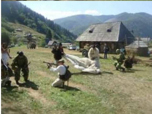
Сцена спектакля «подготовка разведчиков в советской разведшколе».