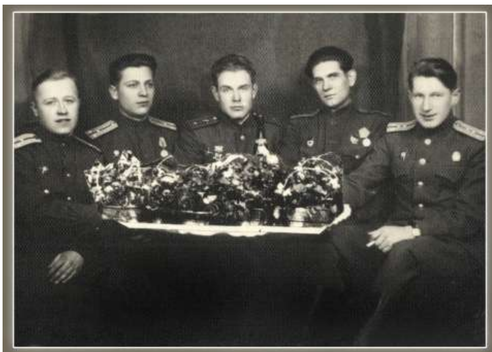
1945г. Ужгородский военный госпиталь.

После капитуляции фашистов война для дивизии не окончилась, её бросили под Прагу на отходящую группировку противника. Здесь же был вновь ранен и контужен, лечился в Ужгородском военном госпитале по ул. Горького.